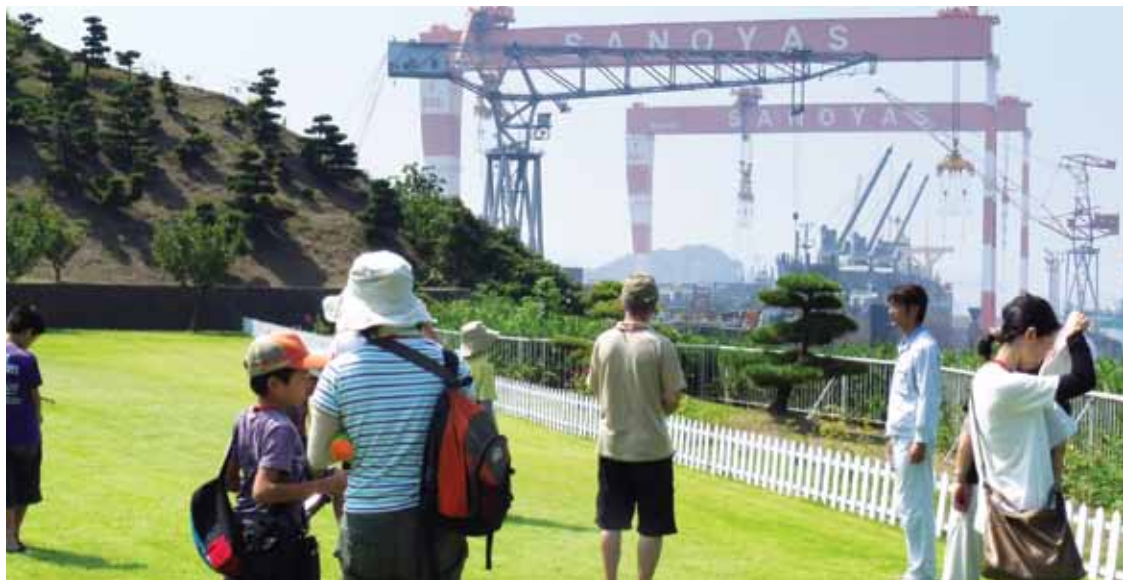
サノヤス造船株式会社水島製作所見学

で、これまで以上にMITAの活動内容を多くの方に知っていただくことができました。これからも、皆様に水島港への理解を深めていただけるような見学会を企画して参ります。