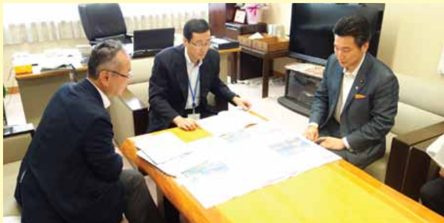
大脇大臣官房技術総括審議官への説明

することになるが、水島港の拠点性が一層高まりつつある状況を踏まえ、必要なものはひるむことなく堂々と要求してまいりたい、また、地元の方が一致団結して地域の思いを声にして国に確実に伝えることが必要であり、是非とも力を貸していただきたい、とのコメントがありました。 また、8月10日、MITA要望団19名は、国土交通省本省への要望活動を実施し、MITA顧問である橋