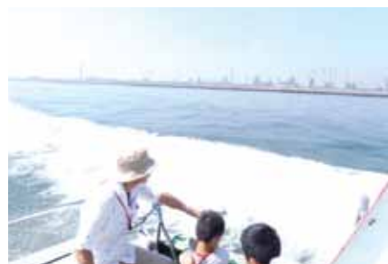
海から眺めるコンビナート