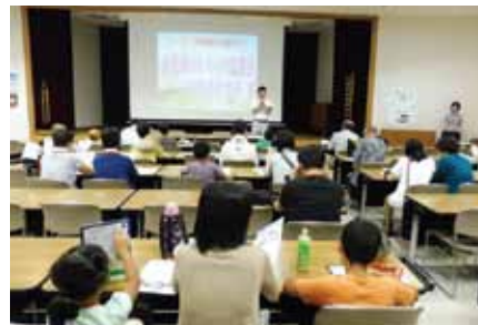
三菱自動車工業株式会社水島製作所見学