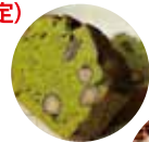
黒豆入り 抹茶ケーキ

★(NPO) 灯心会 スカイハート灯(真庭市) 緑茶・紅茶ティーパック、アート紅茶、こんにやく、 蕎麦かりんとう、桜もち