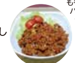
特製キーマカレー

★岡山県立岡山西支援学校(岡山市) 玉ねぎ、きゅうり、なす、クッキー、かご、エコたわし