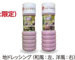
地ドレッシング(和風:左、洋風:右)

★(社福) クムレ クラシス(倉敷市) / やさしい畑クムレ(総社市) きびの国からケーキ、高粱紅茶 玉ねぎ、じゃがいも