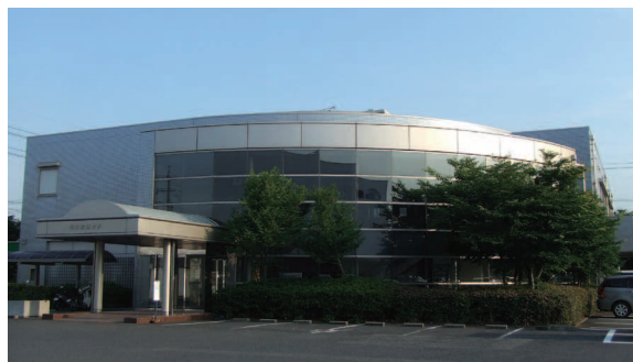
岡山流通会館(テナント入居)