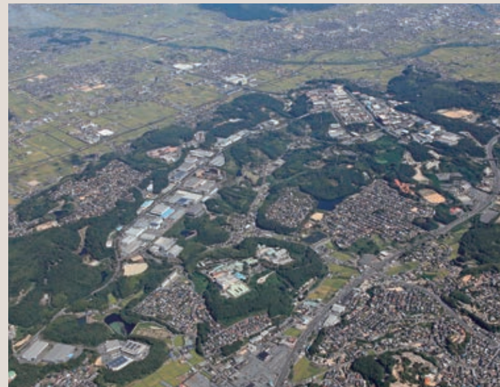
早島上空から流通センターをのぞむ