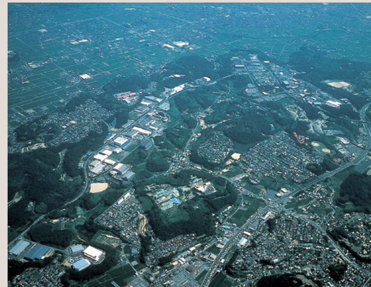
早島上空から流通センターをのぞむ