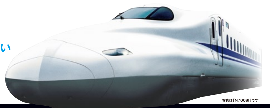
写真は「N700系」です JR西日本岡山 25-18