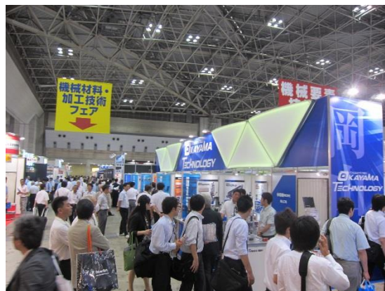
昨年度の会場の様子