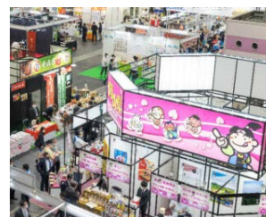
昨年度の見本市出展の様子