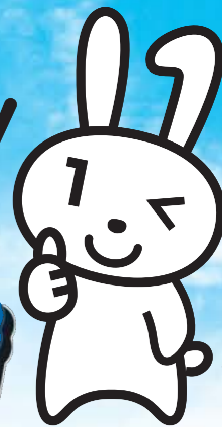
マイナンバー PRキャラクター マイナちゃん