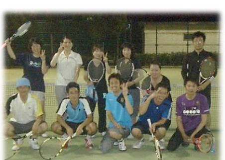
(有)コア構造設計 佃茂樹

仕事あがりですッキリと汗をかきたい方、仕事途中で頭の中をリフレッシュさせたい方、ぜひとも気軽に参加してテニスを楽しみましょう。