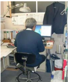
「疲れがベストのショット」