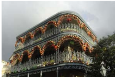
「メリークリスマスで大好きな場所の最新写真です。」