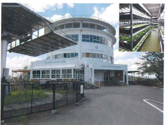
「植物工場」 全日空ビジネスクラス機内食食材に出荷中です。