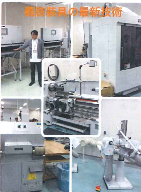
義肢装具の最新技術をライオンカメラの最新技術で編集しました。