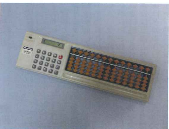
「ソロバン電卓」 最新技術は、そのうち陳腐な物になってしまいますね。その昔、ソロバンで計算していた頃、電卓の出現は大革命でした。最新技術を取り入れようとしていたが、つい従来の物に固執してしまいう...そんな変革への消極的な対応が生み出した商品を、私のコレクションから紹介します。いつの世も割り切れない迷いは存在します