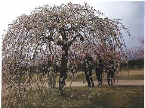
東区神崎梅園の華麗なる『枝垂れ梅』ただただ見とれる……