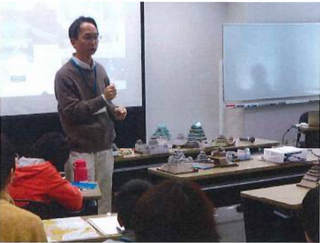
自分なりに頑張ったご褒美として、自分自身とお城の模型をベストショット