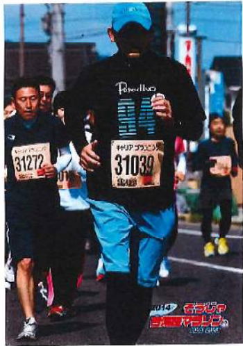
吉備路マラソンにて