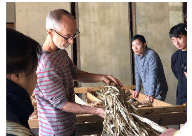
「若い人に土佐和紙の技術を説明する和紙職人」