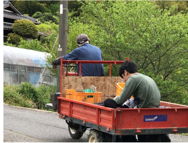
「農作業…祖父から孫へ。つながる…か?!」 スマホを片手にいやいやながら手伝いをする孫。それでも祖父はちょっとうれしい。