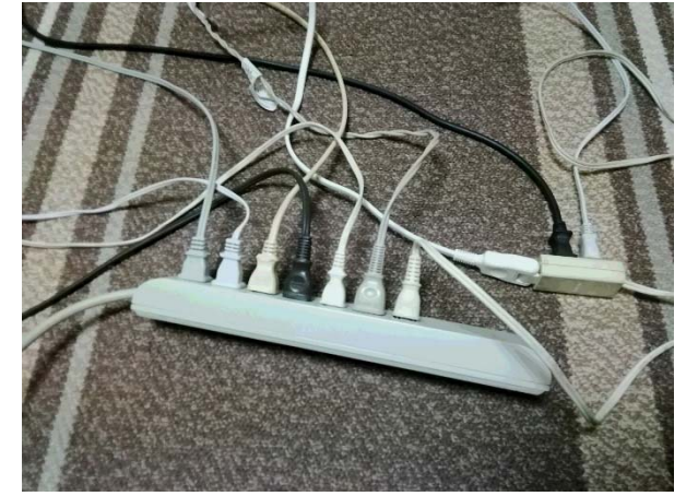
「つながり過ぎは危険!!」 絆や繋がりは大切。でも、場合によります。