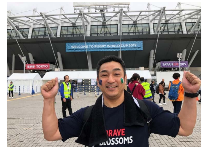
「ボールをつなぐラグビー、日本の大活躍、 2023年フランスにつなげ!!」