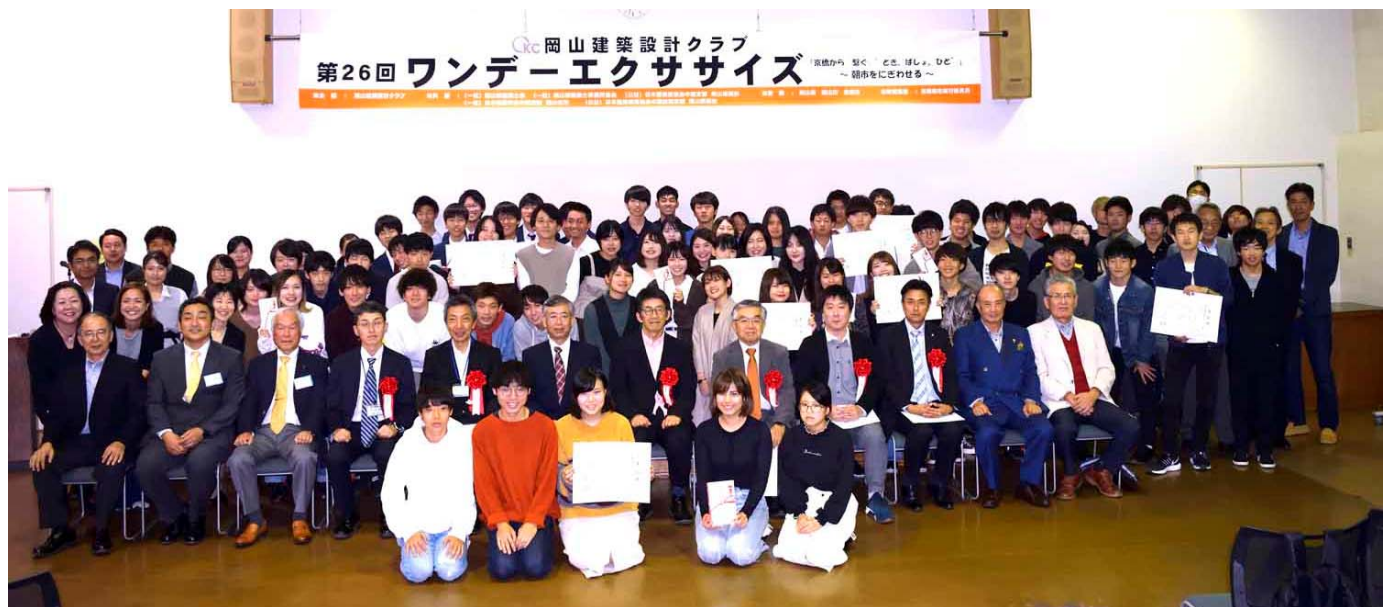
岡山建築設計クラブ 第26回 ワンデーエクササイズ