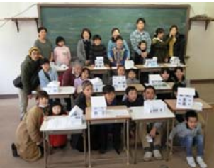
満足出来る家が完成しました