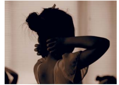
『次のステージ』 (ハレ発表会にむけて進んでいく子供の様子を 背後から撮りました)