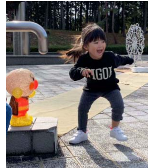
『OKCって 動くことで つながり つながっていく まずは最初の一歩から』