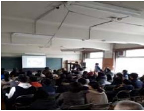
模型作りについて、講師のお話を真剣に聞きました