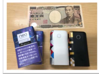
「禁煙しました！」 「喫煙姿を目撃したら一万円」と 社員に宣言しています。