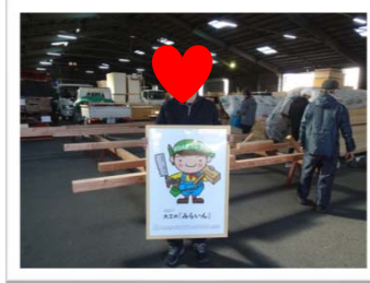
クラウドファンディングのご協力ありがとうございました。 ROAD TO 匠 「大工育成を図って木造建築文化を残 していきたい!」プロジェクトをチャレンジしています。