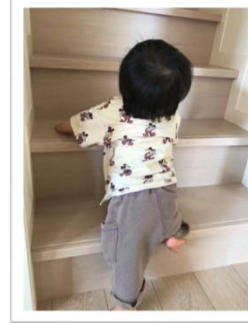
「わんぱくチャレンジ」 コロナ禍に生まれたわが子です が、無事健やかに育ち、階段登 りにチャレンジしております。