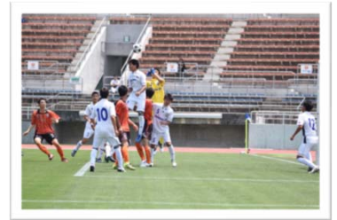
「得点チャレンジ」 攻撃側は最大の得点チャレンジ守りは全力の 防御チャレンジ。 因みに私の応援は攻められている側でした。