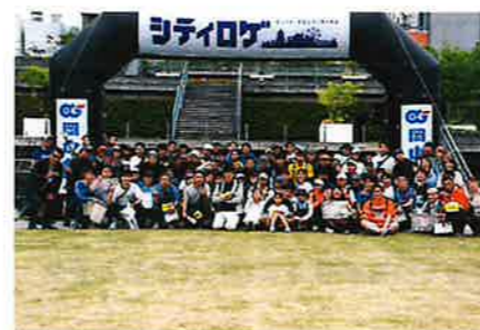
『スポーツ × 観光』 地域をめぐって岡山を盛り上げました