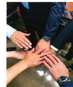
『共に力をつなげる輪』