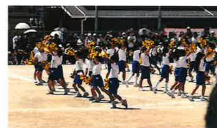
『共に創る運動会』 小学2年の息子の運動会の写真になります。一人一人が一生懸命頑張っている姿をみて胸が熱くなったと同時に、1つのものをみんなで成し遂げるためには個々の頑張りが不可欠だと感じました。