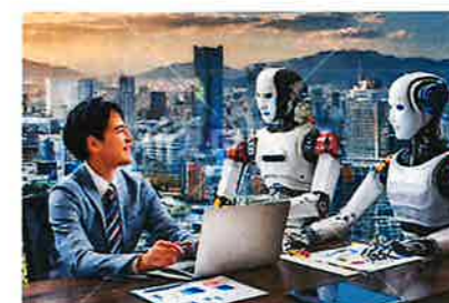
『ロボットと共創!!』 こんな未来も・・・近いかも(´_`)☆