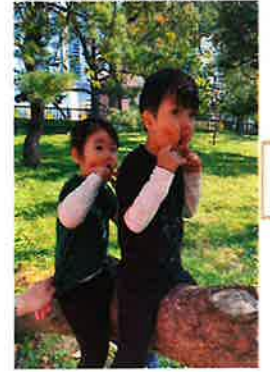
タイトル：新時代のヒーローたち