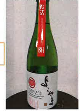
タイトル：よこやまSILVER1814 純米吟醸生酒