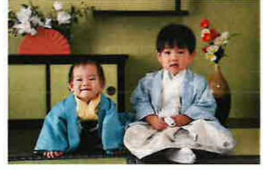
タイトル：わが家の新時代

京都四条の新京極通に「たばこ吸えます」の立て看板なんて...一周回って新しい時代になったんだなあと思います。