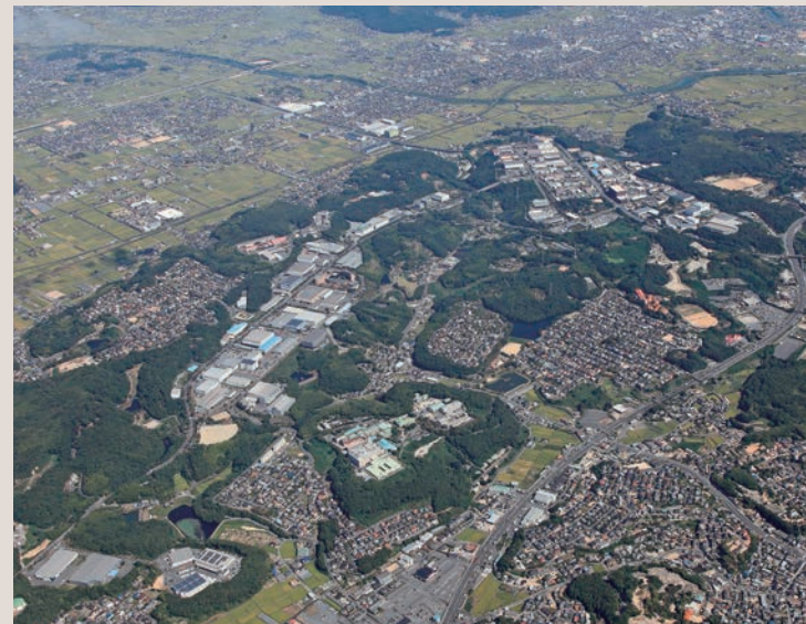
早鳥上空から流通センターをのぞむ