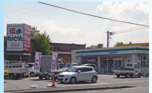
レストラン・コンビニ