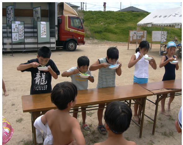
氷の早食い・ラムネの早飲みでは1位を目指してがんばっていました

最近では、メンバーの減少もあり、一人一人がしなくてはいけない役割分担も増えてきましたが、何とか無事に事故もなく、大きなケガ人も出ずに終えられて良かったと思います。当日だけでなく、準備の段階からお世話になった多くの関係者のみなさんありがとうございました。