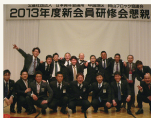
出席者全員で記念写真②