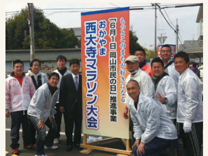
出席者全員で記念写真

またこの事業の主催であるおokayama西大寺マラソン実行委員会には西大寺青年会議所の他にも岡山商工会議所青年部の皆様をはじめ多数の団体の方々が参加され準備などにあたられました。沢山の人が団体の垣根を越えて手を取りあい活動していくことが地域の活性化、そして地域の和を形成することにとって重要なことなのだと思います。最後になりましたが参加者・関係者の皆様本当にご苦労さまでした。