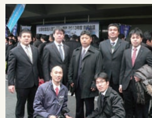
出席者全員で記念写真

最後になりましたが、今年度西大寺青年会議所スローガン「初志貫徹」を胸に刻み、メンバー一同頑張っていますので、皆様のご指導、ご鞭撻をどうぞよろしくお願い致します。