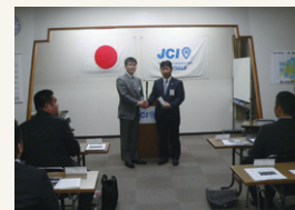
理事長おめでとうございます!