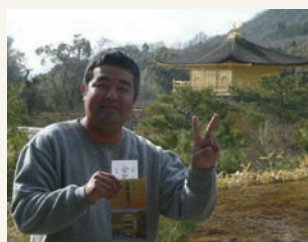
金閣寺にて、パシャッ