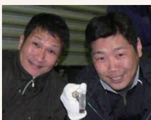
仲良し2人組Part1『これでしょ』