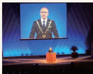
会頭よりお言葉頂きました!