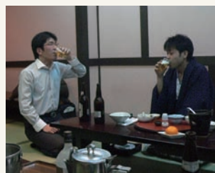
もちろん夜は無礼講で!