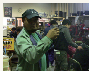
『飲むのはいつ?』『いましてよ!!』