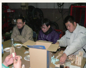
直前も頑張ってます!