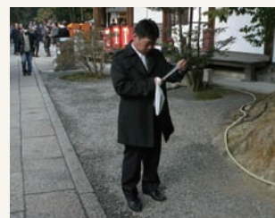
理事長、今年の運勢は…?