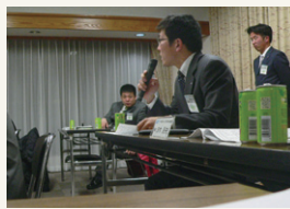
専務の鋭い質問が…