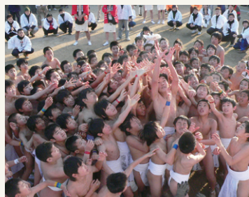
大人達に負けない壮絶な取合です!

来年も引き続き、この子供たちの笑顔と伝統を守る為にも、西大寺青年会議所はより良い事業内容を目指し邁進して参ります。