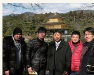
翌日、京都観光しました。