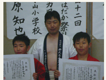
本年度の福男です!