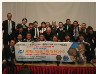
出席者全員で記念写真①

この新会員研修会での経験を今後のJC活動に様々な形で活かしていきたいと思いますのでこれからもよろしくお願いします。