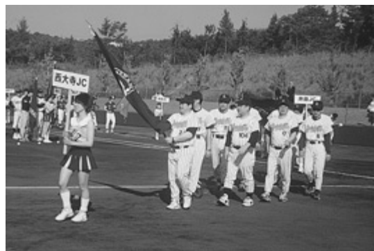
西大寺JC登壇 堂々入場行進