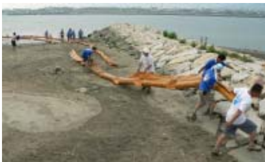
オイルフェンスの片付

河口の碑の除幕式、宝探し、ラムネの一気飲み、ビーチサンダル跳し。吉井川ビーチに遊びに来た方々に楽しんで頂けたか、メッセージは伝わったか、私には分かりません。