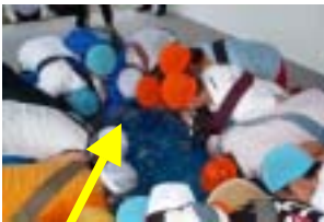
アトラクションにて 奮闘中

最近よく思うのですが、失礼な言い方かもしれませんが、青年会議所は大学生にとってのサークルのようなところでもあるんだな、ということですが、自分があまり社交的でないからということもありますが、働き出してからのことを考えてみると、仕事以外の付き合いは殆ど無かったように思います。そんな自分ですから、会員大会は大変いい経験になったと思います。これから、様々な環境を通して良い関係を築いていけたら幸いです。