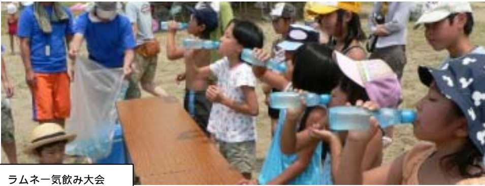
ラムネ一気飲み大会

く事にしました。散らばったピースを様々な方の手をお借りして繋ぎ合わせて行くのですが、初めて委員長を務める私にとって本当に不安でした。