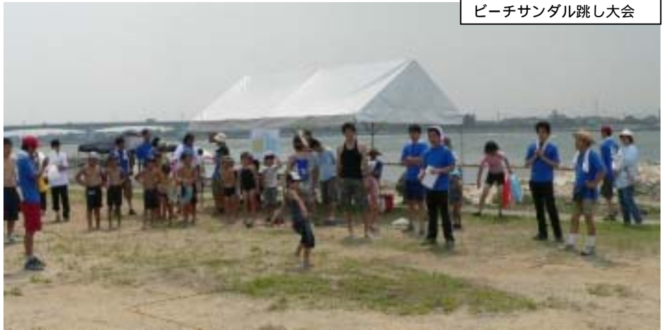
ビーチサンダル跳し大会

07で除幕式をする事になり、不安は拡大されました。そんなある日、理事長がJc3信条について話をされました。「修練友情 奉仕」この言葉はまさにこのパズルに隠された精神であるように思います。