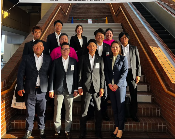
第59回岡山ブロック大会メインフォーラム 演題「夢を持ち続けることの大切さ」 講師 吉田 沙保里 様